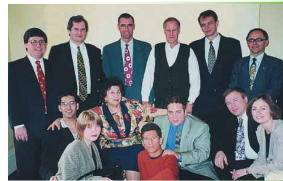
Сотрудники Канадско-Российского проекта борьбы со СПИДом. Санкт-Петербург, 1999 | Canada AIDS Russia Project (CARP) people. Saint Petersburg, 1999

Маэстро РОСТРОПОВИЧ: «Я помогаю быть здоровым молодому поколению моей страны. И поэтому испытываю энтузиазм и счастье». Санкт-Петербург, октябрь 2001 | Maestro ROSTROPOVICH: "I am helping the younger generation of my country to be healthy. This is why I am so happy and enthusiastic". Saint Petersburg, 2001